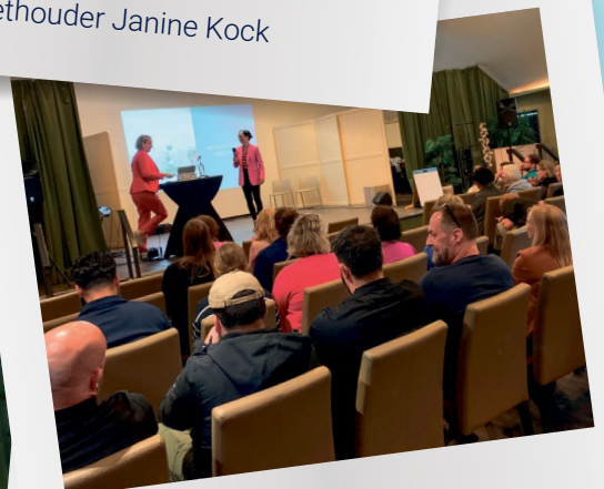
Een impressie vanuit de zaal