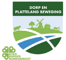
Koen Dieker – Raadslid DorpEnPlatteland Beweging