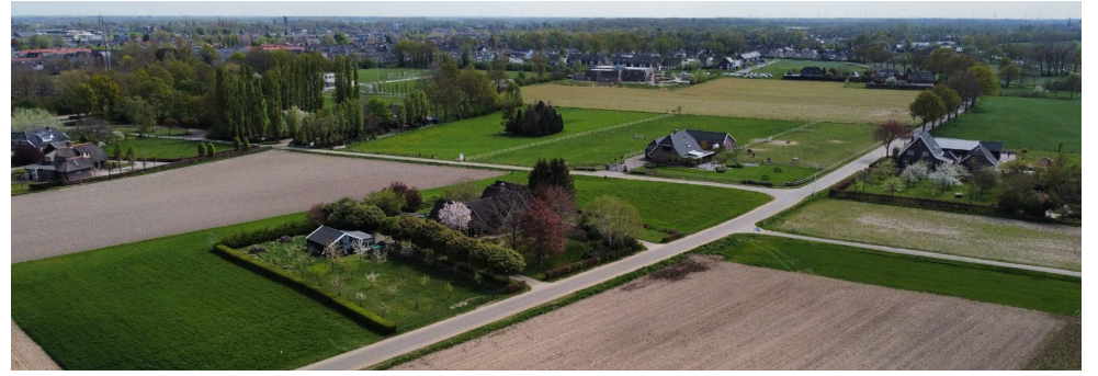
Locatie Biezenakker vanuit de lucht.

In april 2021 heeft de raad vijf locaties aangewezen voor woningbouw. Voor twee van deze locaties, Biezenakker in Ulft en Lenteleven in Gendringen, stelde het college van B&W vorige week het stedenbouwkundig plan vast, waarin 396 woningen voor Biezenakker Ulft en 226 woningen voor Lenteleven Gendringen zijn opgenomen.