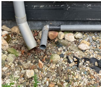
▲ De grindput waar het overtollige regenwater in de grond kan zakken.

De afgekoppelde regenpijpen, bladvangervan en de aansturingssapp. ▶