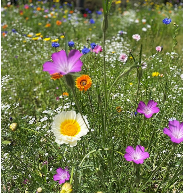
Bloemenmengsels in bloei op begraaf- en gedenkpark Rentinkkamp.