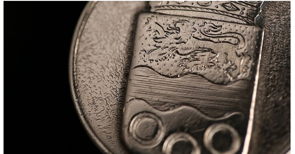
Detail van de ambtsketen.

De gemeenteraad gaat ook graag persoonlijk met u in gesprek over de nieuwe burgemeester. Van 23 t/m 28 september staat 't Praotpunt op verschillende plekken. Raadsleden zijn aanwezig om uw vragen te beantwoorden en met u in gesprek te gaan. Er zijn papieren