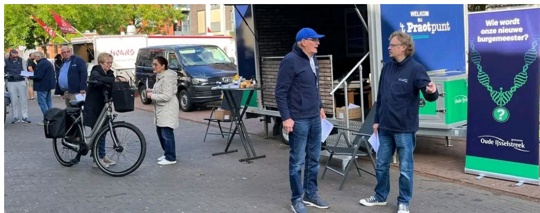
Raadsleden gingen met 't Praotpunt op pad om inwoners te vragen naar hun wensen en ideeën voor onze nieuwe burgemeester.

op pad om inwoners te vragen naar hun wensen en ideeën voor onze nieuwe