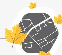
Blad wordt deels opnieuw gebruikt in de wijk