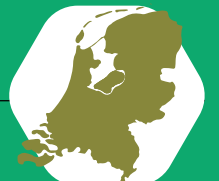
Hergebruik in NL