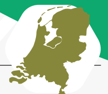
Deel wordt afgevoerd en hergebruikt in NL