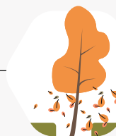
Blad valt niet ver van de boom

Daar waar het kan laten wij bladeren, die in het plantvak terecht komen, liggen. We verwijderen het blad aan de randen om uitwaai te voorkomen.