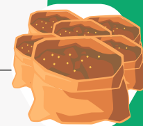
Verwerkt en opgeslagen