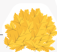
Blad blijft langer liggen op gazons