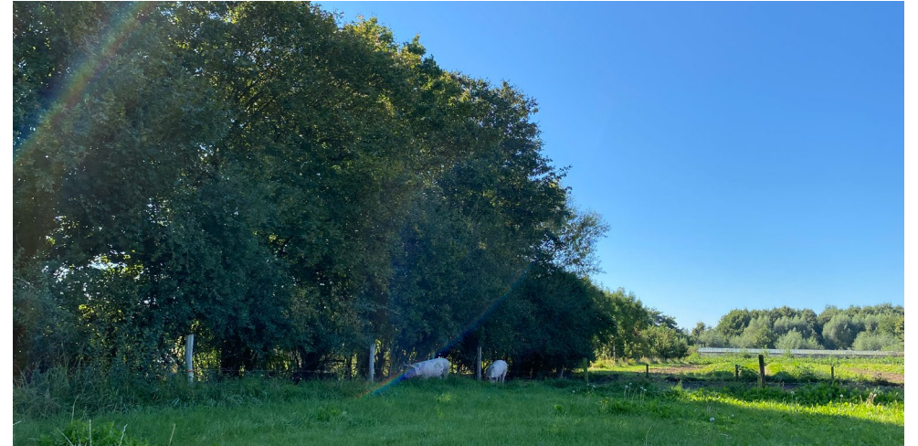
De gemeente geeft subsidie aan agrariërs voor de aanleg van landschapselementen, zoals bijvoorbeeld een houtwal die op de foto te zien is.

Sinds begin vorig jaar kunnen agrarische ondernemers, voor bestand of nieuw aan te leggen landschap, een vergoeding krijgen voor het in eigendom hebben van landschapselementen via het Landschapsfonds. Doel van deze subsidieregeling is om te laten blijken dat we waardering hebben voor het landschapsbeheer dat zij doen.