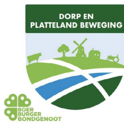
Koen Dieker – Raadslid Dorp EnPlatteland Beweging