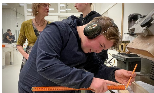
Tijdens een rondleiding door de school gaven leerlingen van het profiel Bouwen, Wonen en Interieur een kijkje in hun keuken.

Thema dit jaar was de toekomst van de jeugd en de samenwerking tussen gemeente, onderwijs en inwoners. De keuze voor het Laudis was dan ook niet toevallig want juist in die omgeving wordt elke dag die toekomst gevormd en worden de talenten van morgen ontwikkeld. Leerlingen van de opleiding Horeca, Bakkerij en Recreatie (HBR) zorgden deze avond voor de catering. Zo konden ze hun werk presenteren en extra oefenen met het lesmateriaal. Een win-winsituatie dus.