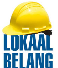
Luuk Wondergem – Raadslid Lokaal Belang